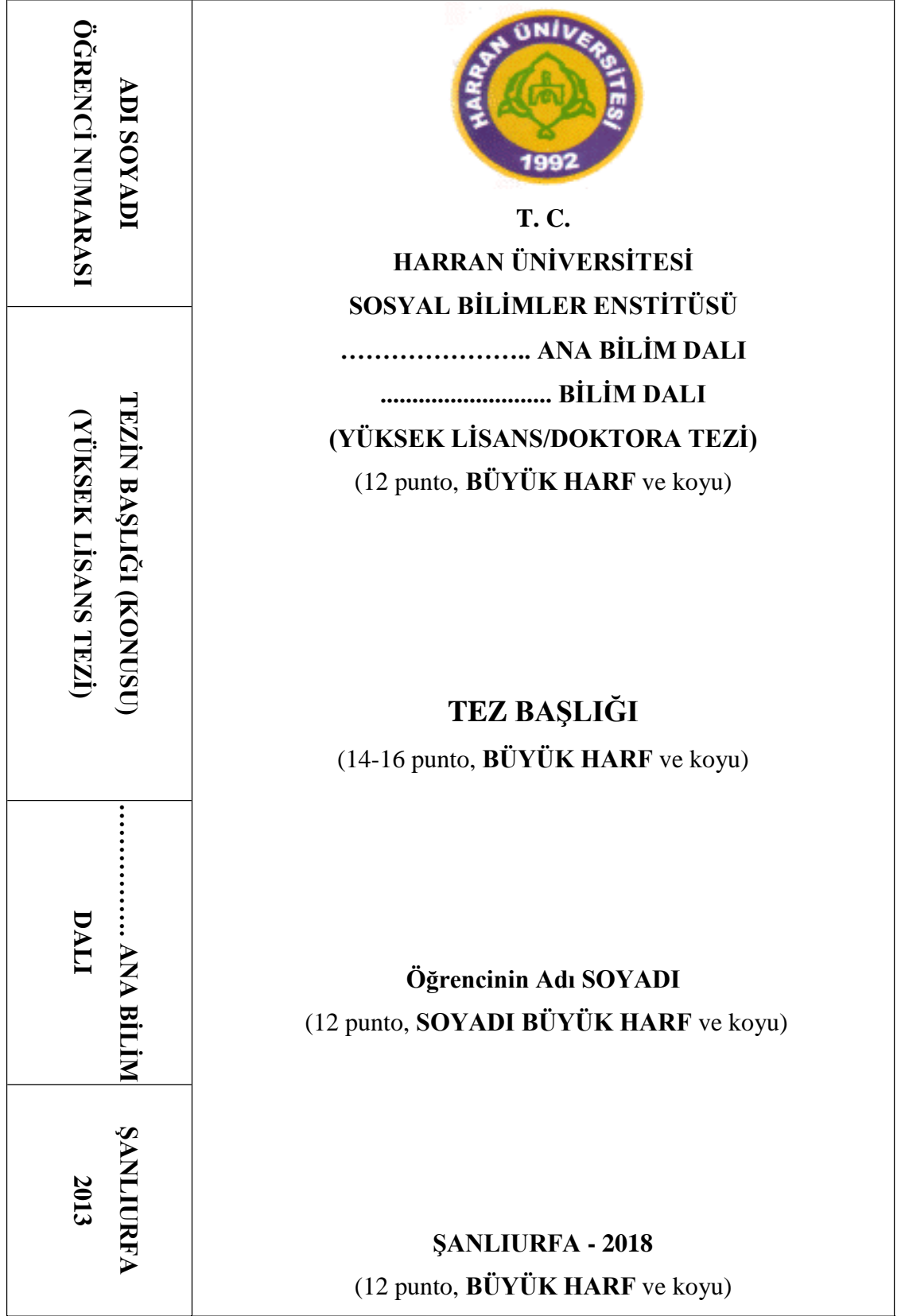
Şekil 2: Dış Kapak Örneği (Sırt Yazısı İle)